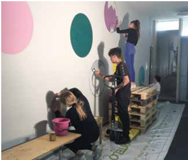
An der Arbeit

Abschlussprojekt 2022, Bildnerisches Gestalten, Bezirksschule Unterkulm.