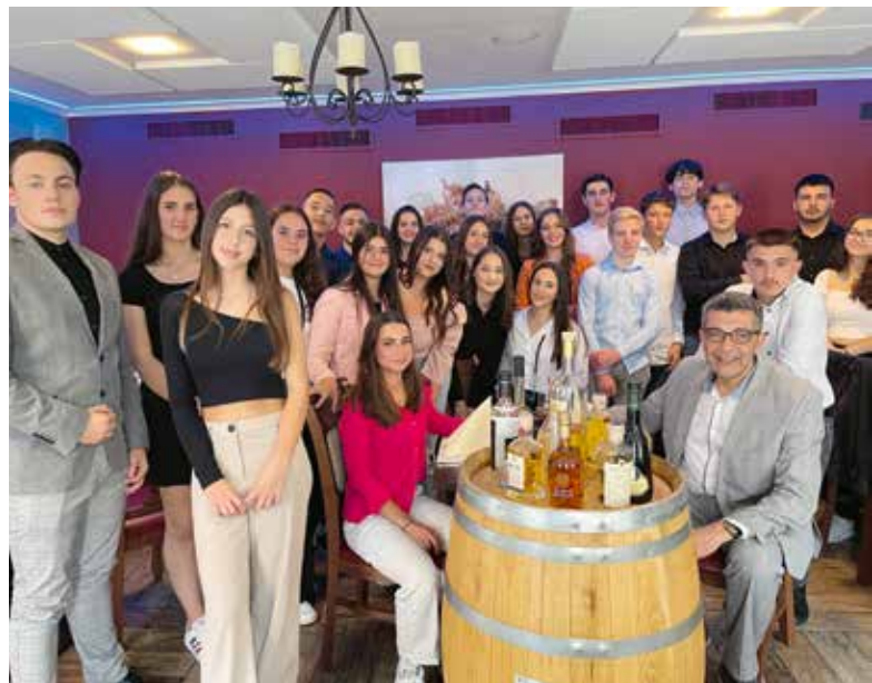
Abschlussessen mit Stil

Zürich: Das Wetter war an diesem Tag leider nicht immer auf unserer Seite. Nichtsdestotrotz durften auch an diesem Tag auf unserer Mini-Tour bestimmte Sehenswürdigkeiten wie das Grossmünster, das Opernhaus, das Niederdorf und die Bahnhofstrasse nicht fehlen. Das Zurich Film Festival fand zeitgleich statt, wo das Modell Mercedes Vision AVTR